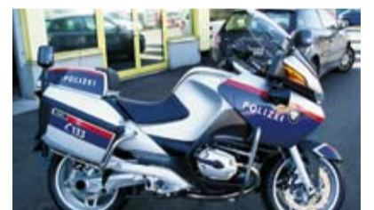
Egal ob auf Fahrzeugen, Gebäudefassaden, Schildern oder Transparenten – Gradinger sorgt dafür, dass die Werbebotschaft im Gedächtnis bleibt.